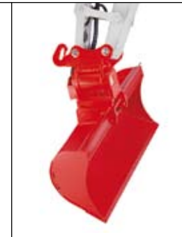
Pevná svahovací lopata s naklápěcí hlavou PowerTilt