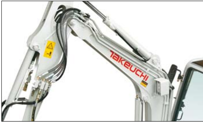
3 přídavné hydraulické okruhy pro využití přídavných zařízení, z toho 1. a 2. okruh jsou řízené proporcionálně. Volitelně 4. přídavný hydraulický okruh.