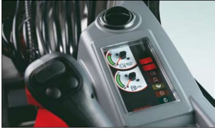
Palubní deska se zvukovým i vizuálním varováním v případě poruchy během provozu.