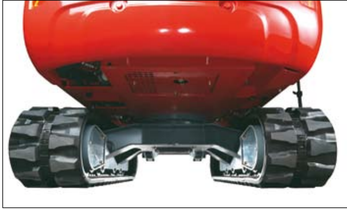
Vysoká světlá výška, mimořádně chráněný podvozek i nástavba.