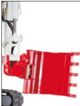
PowerTilt s hydraulickou rychloupínací deskou, lopata otočená na "horovku"