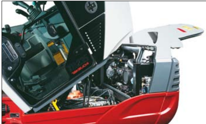
Sklopná kabina s výborným přístupem k motoru a hydraulickým agregátům.