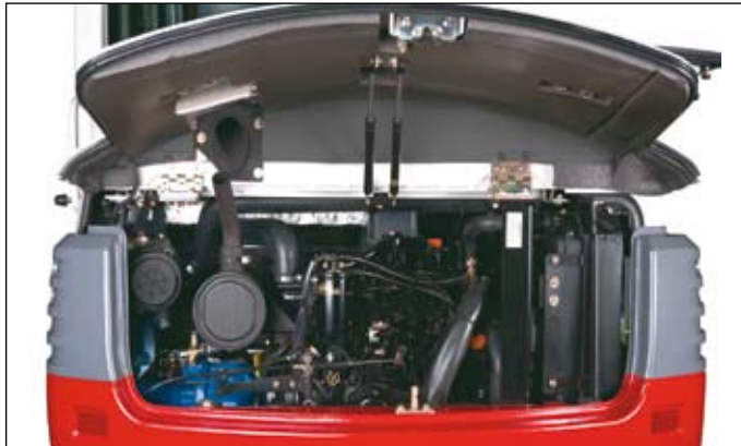
Generace tichých motorů s redukováním množství výfukových plynů, velký motorový prostor, výfuk směrem vzhůru, masivní protizávaží.