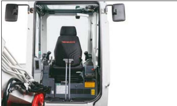
Prostorná kabina tlumící hluk a vibrace s komfortním sedadlem, široký vchod s masivním dorazem dveří, sklopné čelní sklo.