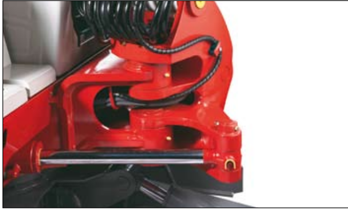
Robustní otočný kozlík se speciálně ochráněnými hadicemi i hydraulickým posuvem.