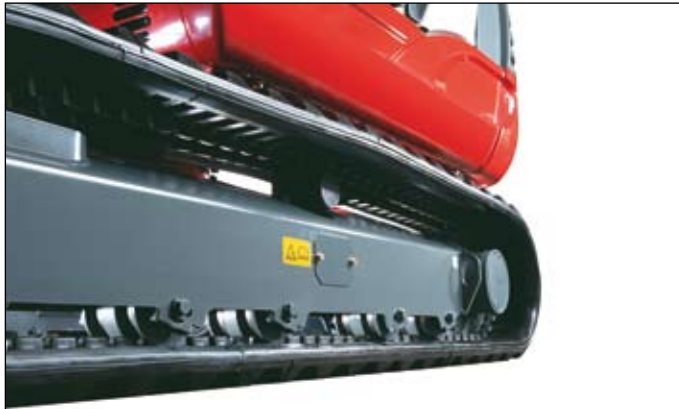
Rolny s vnitřním i vnějším vedením zamezují vyzutí gumového pásu, gumové pásy s krátkou roztečí minimalizují vibrace při jízdě.