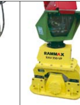
Přídavná vibrační deska