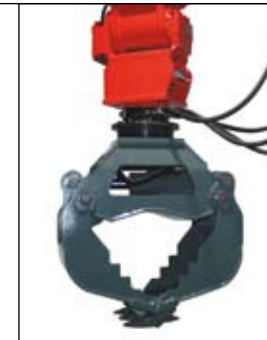
Naklápěcí hlava PowerTilt s drapákem