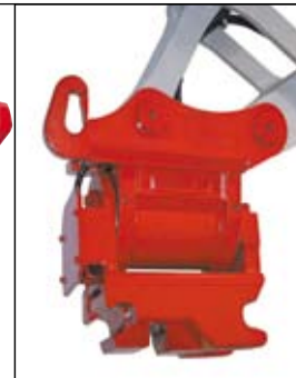
PowerTilt s hydraulickým rychloupínačem