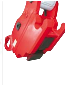
Hydraulická rychloupínací deska